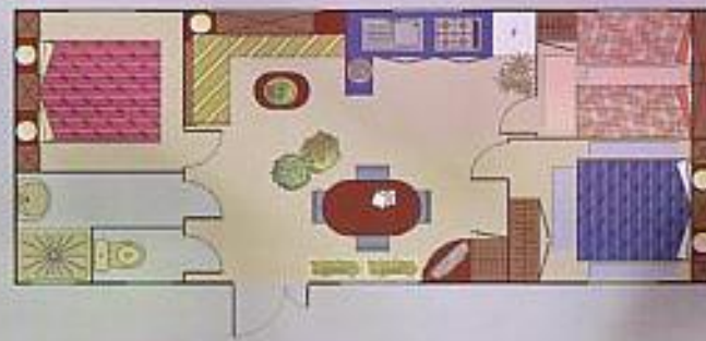
Espace 2000 9,20x3,66